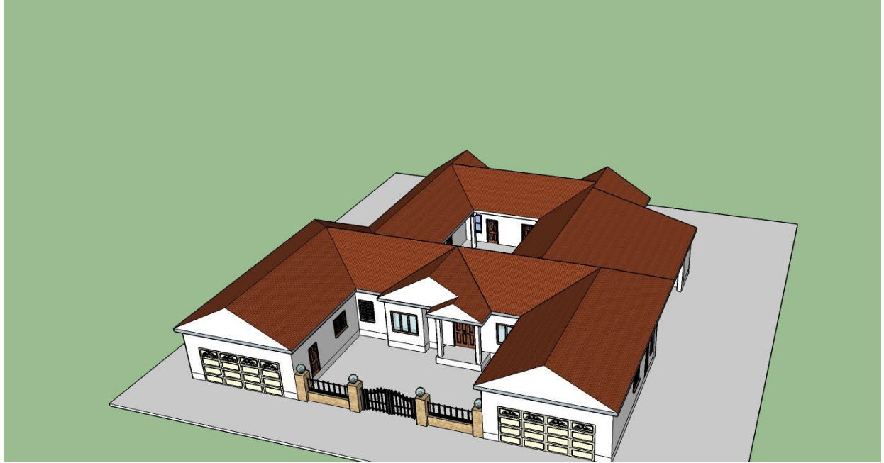
图 1 房子三维图

再梦想种什么果树才能与“恬、甜、田”这三个同音字相吻合。反观自己几乎天天吃红枣，每天都享受着这有“恬、甜、田”意境的果实：凡是果园都恬适宁静，枣园也不例外；“大红枣儿甜又香，送给咱亲人尝一尝”，枣是甜在亲人的心窝窝里啊；大枣也不是什么高大上的水果，在中国已经有几千年的栽培历史，陕西山西老乡家的门前山后都可见它们那翡翠般的叶子和玛瑙般的果实，很接地气，很田园。大枣那高含量高品质的维生素和矿物质，是补血佳品。从科学的角度来说，枣树耐干旱，喜欢阳光充足和昼夜温差大的气候， Brentwood 正是枣树最好的家园。“就是它了，种大枣！”我对先生说。