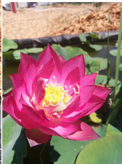
图 6. 尝试浅水养藕之二

一天晚上先生又打电话来：“老婆啊，你快点来，我们一起种东西啦，好好玩啊！”我白天正好接到 Kumon Chicago Branch 经理的电话，不允许我把我的 Kumon center 卖给我现在的买家，因为她不够资格。去年该买家向 Kumon 申请要开一家 Kumon. Kumon 对她又面试又考试又背景调查又要资金证明，4月初把她转来给我，我从4月初到9月初，一直