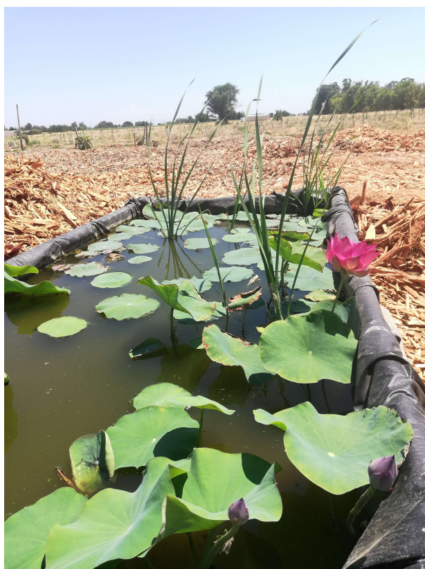
图 5. 尝试浅水养藕之一