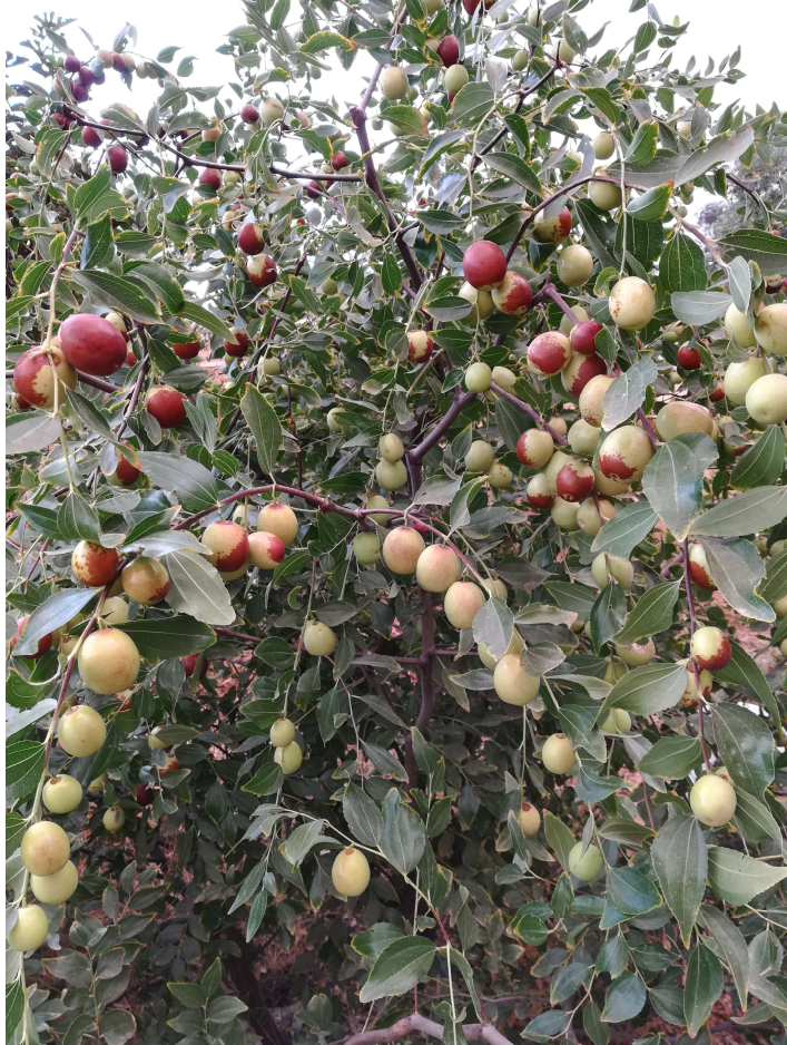
图 2. 种大枣

先生本来是个宅男，我有时太忙，叫他去后院帮我浇水，他会用一桶水向我心爱的花泼过去，就像跟花儿说：“死你就去啦！”（用广州话读！）。家里煮饭了，叫他帮忙去后院摘点青菜，转了一圈，两手空着回来，只好我上阵，才转半圈，就收获一大盆青菜豆角。