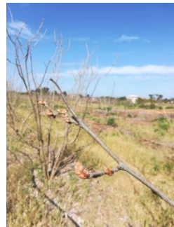
被冻死的桑树的结果枝