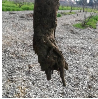
被地鼠咬了根的枣树 (1)