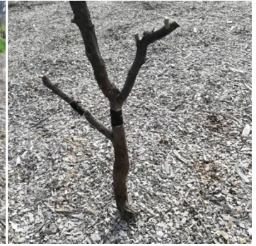
被地鼠咬了根的枣树 (2)