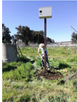
把 Owl Box 竖起来