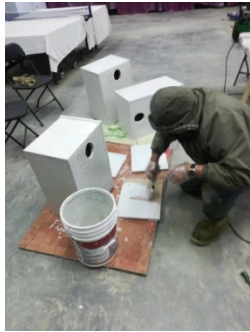
先生在做 Owl Box