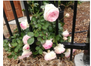
希望几年后长成一堵玫瑰墙