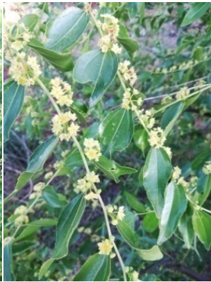
图 2. 枣花 2