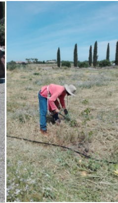
图 4. 用大刀砍草