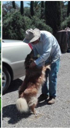
图 3. 先生和家狗 Pix