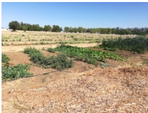
图 25. 菜园一角