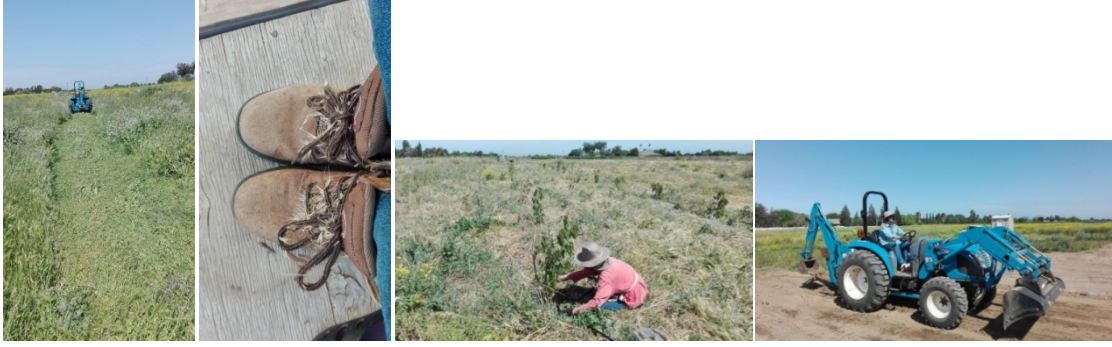
图 5. 先生开拖拉机压草 图 6. 草插满工作鞋 图 7. 用钉子把水管固定 图 8. 开拖拉机