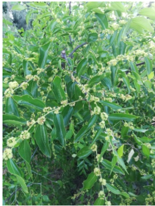
图 1. 枣花 1