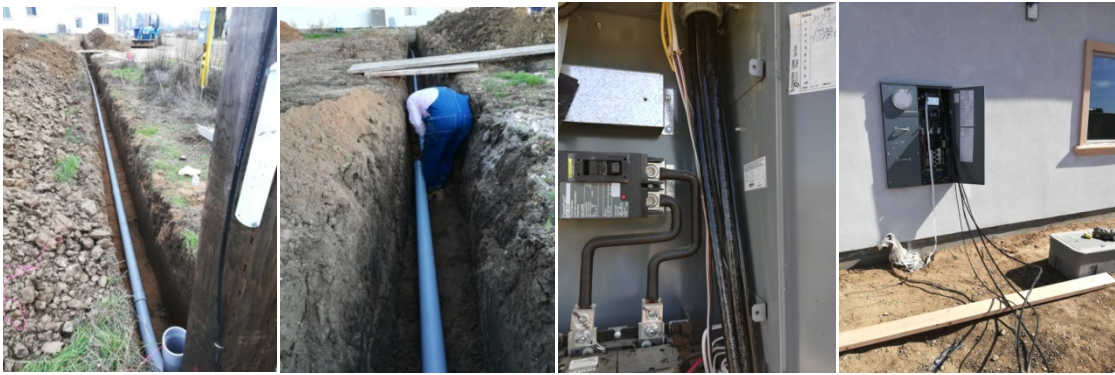
图 9. 挖沟铺电缆 图 10. 铺电缆 图 11. 把电缆拉到配电盘 图 12. 拉电缆