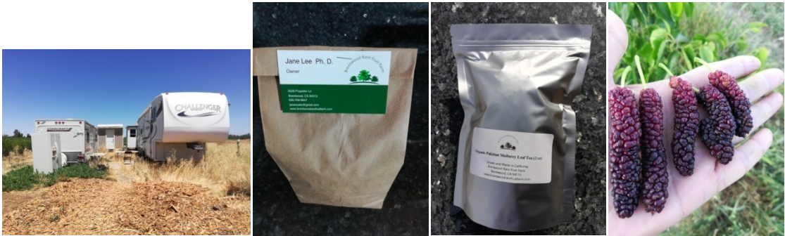
图 13. 大小房车和小 shed 图 14. 有机桑叶茶简装 图 15. 有机桑叶茶精装 图 16. 有机桑葚